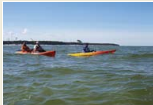
Laivotāji ceļā uz Kolkas bāku