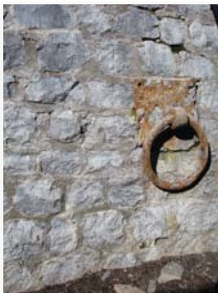
Kolkas bākas mūris