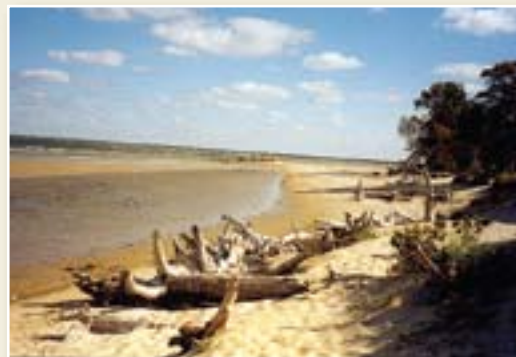
Krasts pie "Ūšiem"