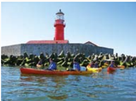
Laivotāji pie Kolkas bākas