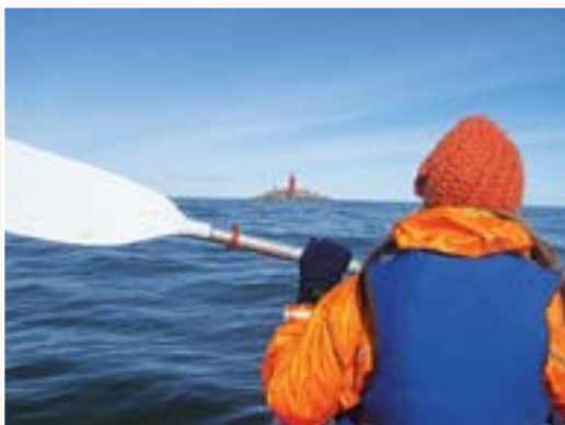
Ceļā uz Kolkas bāku

4 Kolkas bāka – uz mākslīgi veidotas salas jūrā (salu uzbēra 1872.–1875. g.) sākotnēji uzcēla koka bāku, kurā gaismu iededza 1875. g. jūnijā. Kad sala nosēdās, uz tās uzcēla tagadējo bākas torni, kas sāka darboties 1884. g. 1. jūlijā. Bāka mūsdienās atrodas 6 km (ceļšanas brīdī – 5 km) attālumā no Kolkasraga, tā zemūdens smilšainā sēkļa galā. Uz salas vēl atrodas bākas uzrauga ēka un vairākas saimniecības ēkas. 21 m augstais bākas metāla konstrukcijas tornis izgatavots Sanktpēterburgā. Kopš 1979. g. bāka strādā automātiskā režīmā.