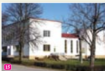
Lībiešu tautas nams