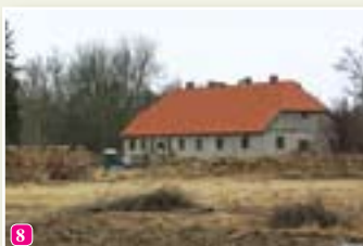
Bijušās mācītājmuižas dzīvojamā ēka