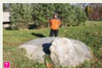
Mēra akmens pie baznīcas