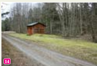
Bijušais šaursliežu dzelzceļš