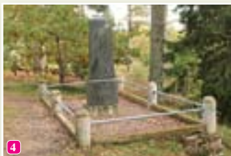
Vecā Taizeļa piemineklis