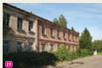
Bijušās Jūrskolas ēka