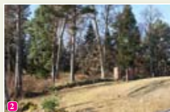
Veco kapu kalniņš