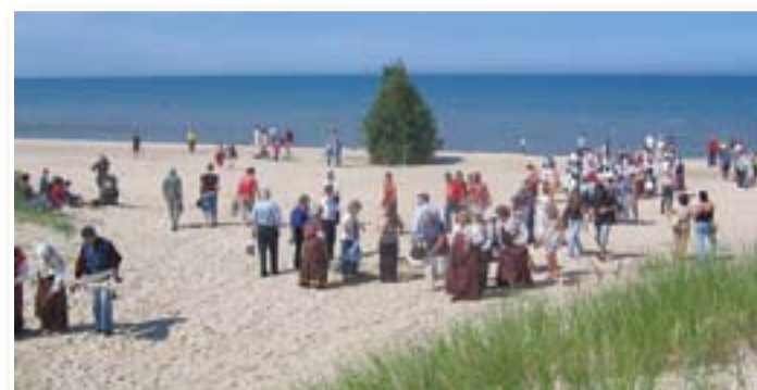
Jūras krastā pie Mazirbes.