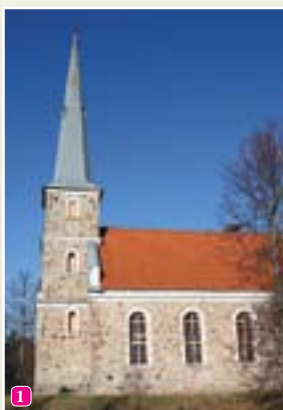
Mazirbes luterāņu baznīca

22 Bijusi kroga vieta – Ūbelēs, Mazirbes – Cirstes ceļa malā.