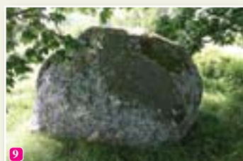
Lielais Mēra akmens